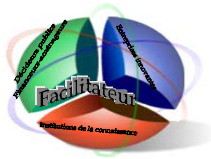
Figure 2 : Le triangle d'or ou l'écosystème de la connaissance